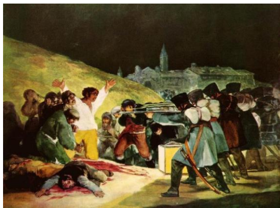
Goya: Fusilamientos del 2 de mayo

Con el estallido de los levantamientos y las Abdicaciones de Bayona se produjo un vacío de poder y la ruptura del territorio español . Para controlar la situación en las regiones no ocupadas por el ejército francés, los ciudadanos más prestigiosos establecieron un nuevo poder: las Juntas Provinciales , que asumen su soberanía y legitiman su autoridad en nombre del rey ausente. Con delegados como Jovellanos, quedó constituida en Aranjuez (septiembre de 1808), bajo la presidencia del Conde de Floridablanca, la Junta Central Suprema , que tomó para sí los poderes soberanos y se erigió en el máximo órgano gubernativo en su lucha contra los franceses.